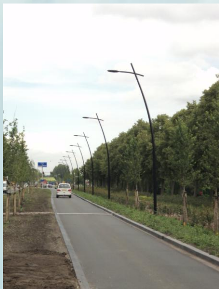
Zijdelweg in Uithoorn met conisch gebogen aluminium lichtmasten van Sapa